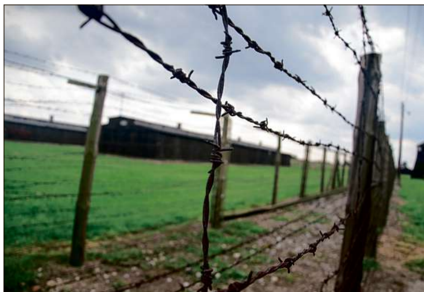
Blers anteriurs champs da concentraziun furman oz lieus da commemoraziun (Majdanek, Pologna).

Dapli infurmaziuns: chatta.ch/?hiid=3177 www.chattà.ch