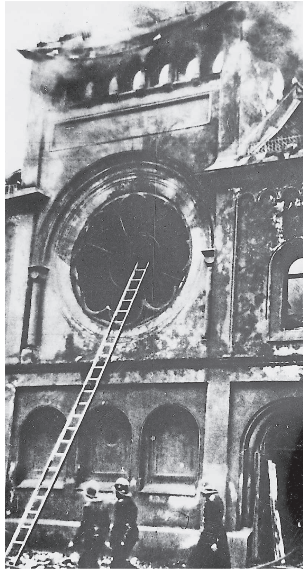
Eine in der Nacht vom 9. auf den 10. November 1938 zerstörte Synagoge in Berlin.

Die Novemberpogrome fanden vom 9. auf den 10. November 1938 statt. Die Nazis nannten diese Nacht zynisch «Reichskristallnacht». Sie wurde von ihnen organisiert und gelenkt und als Ausdruck von «Volkszorn» hingestellt. In jener Nacht und in den Folgetagen wurden etwa 400 Menschen ermordet oder in den Selbstmord getrieben. Ab dem 10. November wurden rund 30 000 Juden in Konzentrationslager (KZ) verschleppt, wo Hunderte ermordet wurden oder an den Haftfolgen starben. Die Pogrome markieren den Übergang von der Diskriminierung der deutschen Juden seit 1933 zur systematischen Verfolgung bis hin zum Holocaust.