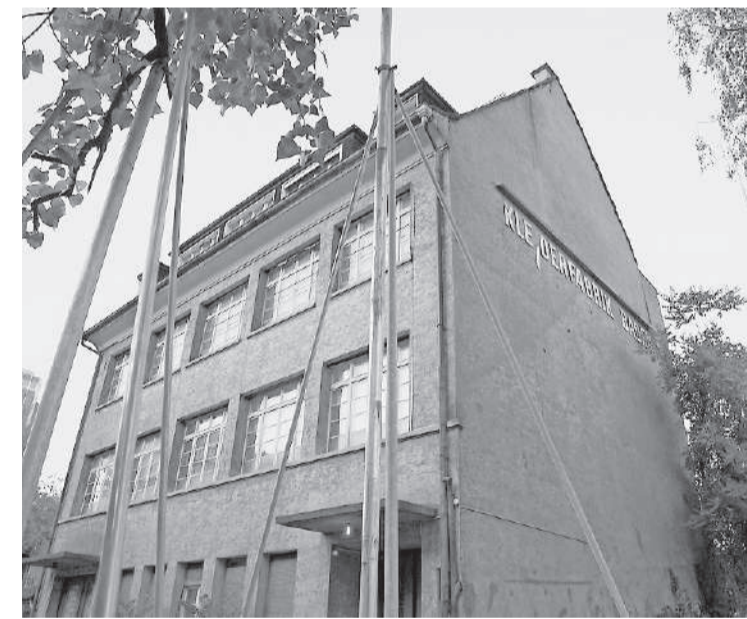
Die Kleiderfabrik Baden 2007 kurz vor dem Abriss.