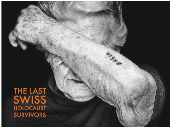
מתוך התערוכה ■ צילומים: באדיבות קרן גמאראל

שואה אשר מצאו מקלט בשווייץ בתקופת השואה ולאחריה. אנו רואים חשיבות עליונה בהבאת סיפוריהם של ניצולי השואה לציבור הרחב - בארץ ובעולם - במיוחד בעידן בו אנו חיים כיום. סקרים ומחקרים רבים מלמדים על עלייה מדאיגה בבורות הקיימת ברחבי העולם בכל הנוגע לשואה ולגורל היהודים בשואה. לצד בורות זו, מופיעים במדינות השונות נרטיבים חדשים שבין השאר מגמדים את שיתופי הפעולה של חלק מאזרחי אותן מדינות עם השלטונות הנאצים ברדיפה של היהודים, ומציגים עצמם כקורבנות של גרמניה הנאצית."