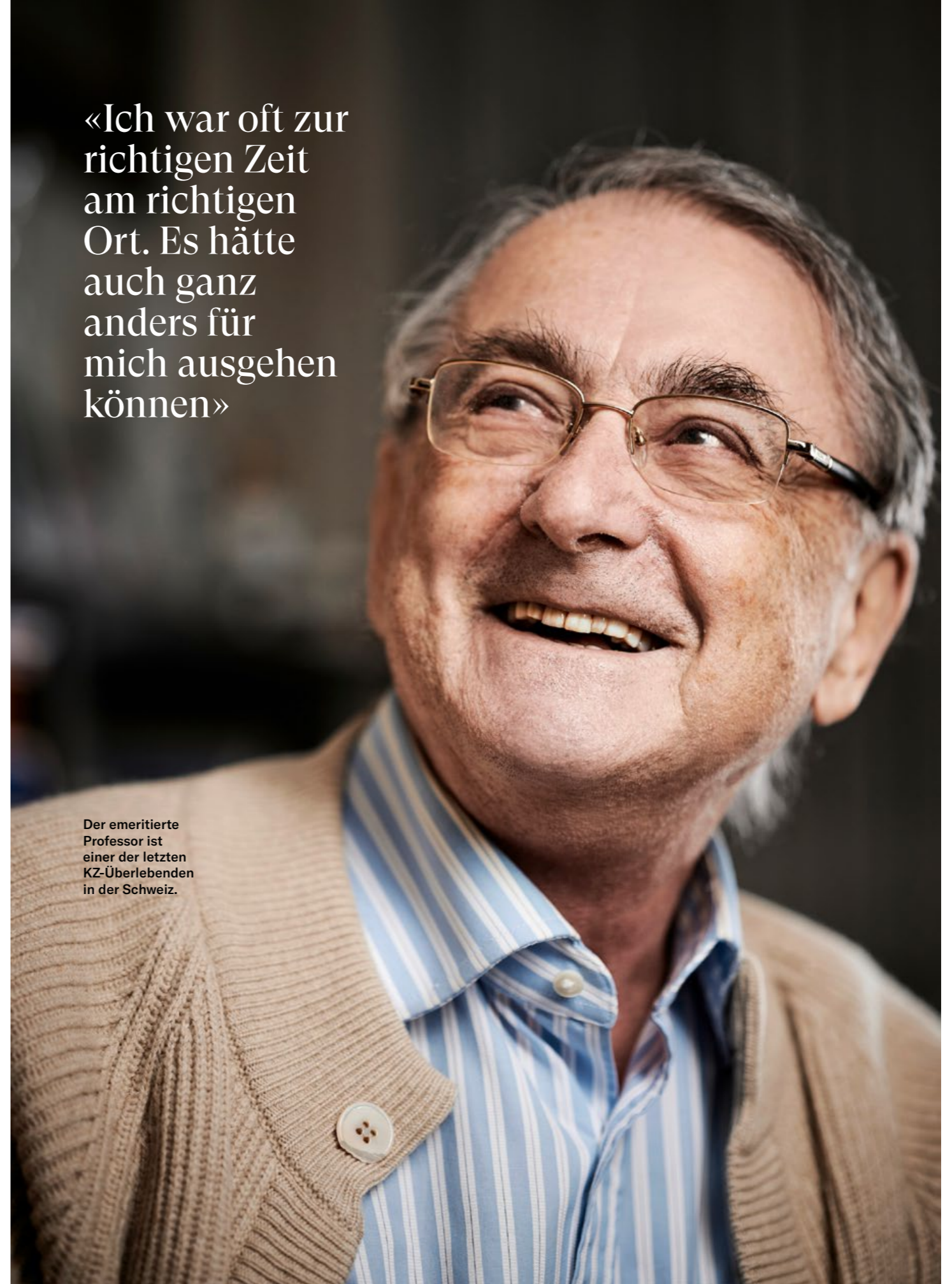
Der emeritierte Professor ist einer der letzten KZ-Überlebenden in der Schweiz.

«Ich war oft zur richtigen Zeit am richtigen Ort. Es hätte auch ganz anders für mich ausgehen können»